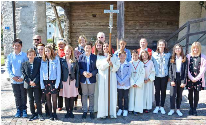
Firmlinge von Gampel