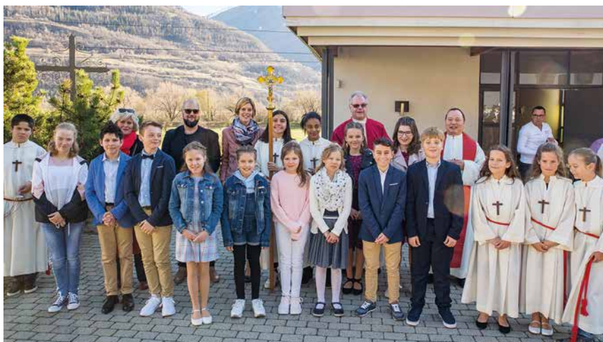
Firmlinge von Niedergampel

Den frisch Gefirmten und fürs Leben Gestärkten wünsche ich alles Gute und vor allem die Gaben des Heiligen Geistes: Weisheit, Einsicht, Rat, Stärke, Erkenntnis, Frömmigkeit und Gottesfurcht.