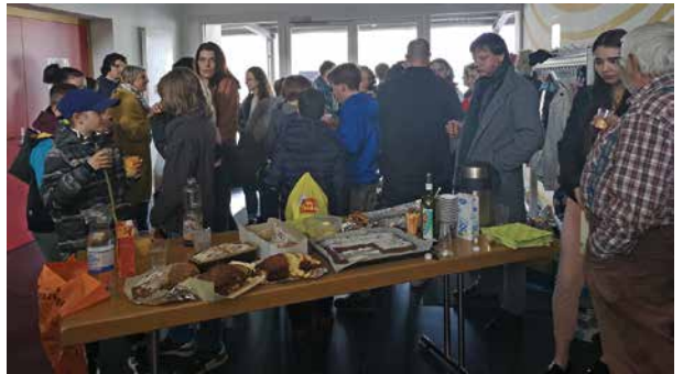
Impulsabend mit den Firmlingen und ihren Paten