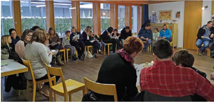
Impulsabend mit den Erstkommunikanten und ihren Eltern